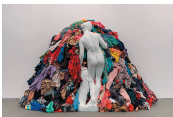
La venus de los harapos, 1967