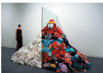
Obra de Pistoletto en una exposición