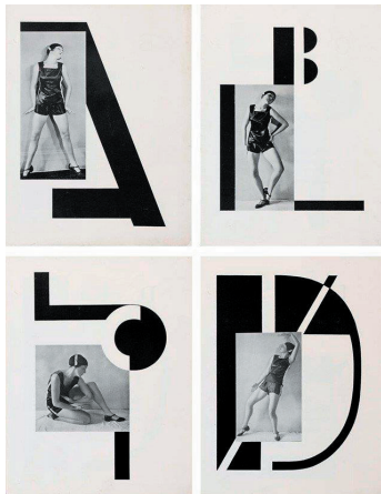
Ilustraciones del libro Abeceda , 1926.

Con las llamadas Vanguardias Históricas las letras y la tipografía pasaron a ser valoradas no tanto por su contenido y significado cuanto por su forma y por su estética. La apariencia de estos signos gráficos y la experimentación con su