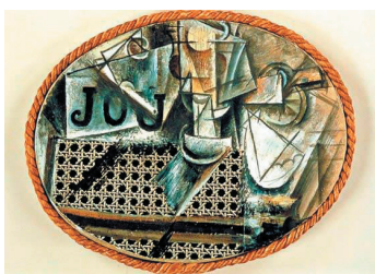
Picasso, Naturaleza muerta sobre silla de rejilla , 1912.