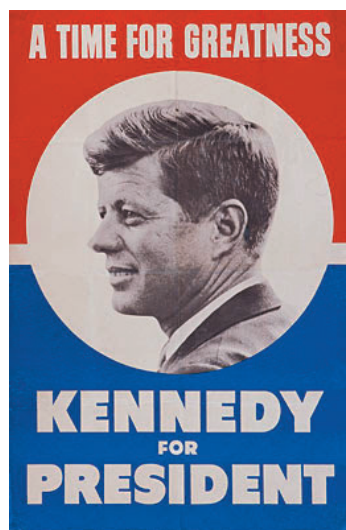
Cartel de la campaña presidencial de J.F. Kennedy

consideración artística, a la vez que les sirvió a ellos mismos para difundir y dar a conocer su obra ampliamente. De esta manera y ante la enorme proliferación de carteles, las ciudades acabaron convertidas en una especie de exposiciones de arte al aire libre.