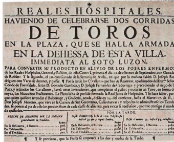
Cartel taurino (el primero del que se tiene constancia), 1837

Porque las vanguardias artísticas de principios del siglo XX en las que militaban buscaban sobre todas las cosas romper con la concepción tradicional del arte predominante hasta entonces y centrada en los géneros clásicos de la pintura y la escultura. Al cultivar el género del cartel, los artistas elevaron su