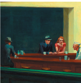
Nighthawks (fragmento), 1942