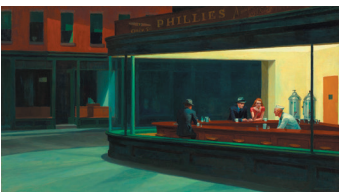
Nighthawks , 1942

Durante la II Guerra Mundial y después del ataque de Pearl Harbor que precipitó la entrada de EEUU en la contienda, la ciudad de Nueva York sufrió periódicamente los conocidos como blackout drills , episodios que apagaban todas las luces exteriores de la ciudad y espacios públicos, con el fin de dificultar