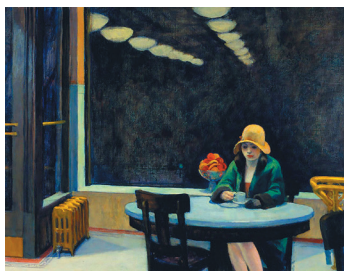
La Autómata, 1927

a la aviación enemiga la localización de sus objetivos. Es probable que Hopper encontrara inspiración en dichos episodios.