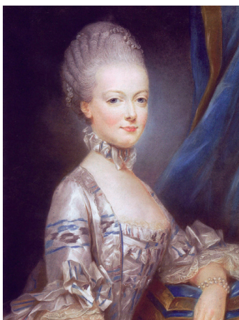
Archiduquesa María Antonia de Austria, futura Reina María Antonieta de Francia, 1769

El retrato que realizó de María Antonieta fue el que se utilizó para “presentarla” al rey Luis XVI, quien quedó maravillado con la belleza de su prometida. Este hecho llevó a la propia María Antonieta a nombrarle barón y Primer Pintor de la Reina , aún sin pertenecer a la Real Academia de Pintura y Escultura , algo que por entonces era condición necesaria para que un artista pudiera ostentar ese cargo. Sin embargo y a pesar del reconocimiento , Ducreux no solía firmar sus obras, motivo por el cual muchas de ellas han sido atribuidas a otros artistas.