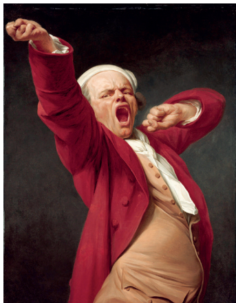
Autorretrato bostezando, 1873

El francés Joseph Ducreux fue un reconocido pastelista, miniaturista, grabador y pintor de retratos de corte del siglo XVIII . Aunque se ganó la vida haciendo retratos tradicionales, es conocido sobre todo por los que hizo con un estilo más “informal”, y que se caracterizan por mostrar a los retratados haciendo muecas y mostrando multitud de expresiones .