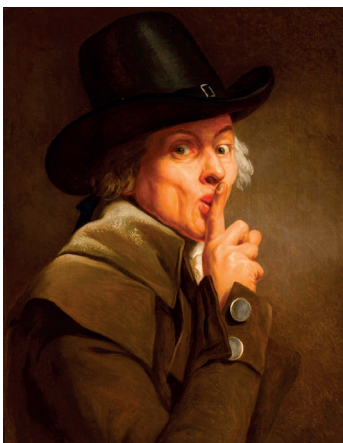
El silencio, 1790

La fisiognomía es una pseudociencia basada en la creencia de que los rasgos físicos de una persona (principalmente su rostro) están vinculados a su carácter o personalidad. Su origen se remonta a la Antigua Grecia y está vinculado a Aristóteles y la escuela peripatética. Más tarde, en el Renacimiento tardío, se recopiló toda la información existente hasta entonces y se reunió en una sola obra que establecía diferentes elementos de análisis fisiognómico, como el color de la piel, el tipo de carne, el cabello, el movimiento y la voz.