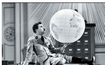
El gran dictador

ritarismos en la que es imposible no ver reflejado a Hitler y su obsesión expansionista y conquistadora. A pesar de que resultaría su mayor éxito comercial, en muchos países el film no pudo proyectarse hasta el final de la guerra –como fue el caso de Francia, Italia o España– aunque había sido rodada desde la distancia –en 1940– cuando EEUU aún no había entrado en el conflicto. El discurso que pronuncia el protagonista al final del film ha pasado a la historia como un gran alegato por la democracia, la paz y la tolerancia.