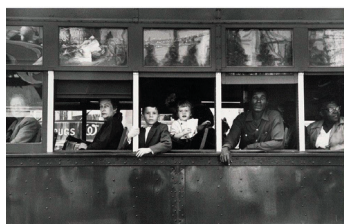
Imagen del libro Los americanos , de Robert Frank

Otro referente fue Walker Evans (1903-1975), uno de los padres de la fotografía documental americana. Uno de sus más importantes trabajos lo hizo Evans fotografiando -por encargo del Dpto. de Interior estadounidense- a la América rural durante la Gran Depresión del 29. La naturalidad y la dignidad con las que retrató a estas personas le convirtieron enseguida en un referente de la nueva fotografía documental americana. Otra de sus series destacadas fue la que hizo retratando a escondidas a la gente que viajaba en el metro de Nueva York, con su cámara oculta bajo el abrigo. “Mira fijamente, curioseas, escuchas a escondidas. Muere sabiendo algo. No estarás aquí por mucho tiempo” , fue una de sus máximas.