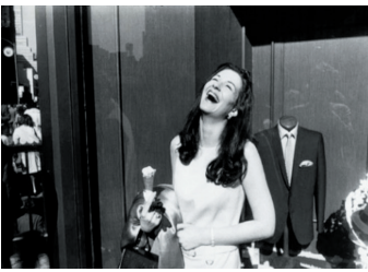
Mujer riendo con cono de helado, 1968

Winogrand pensaba que la fotografía no es narrativa, que no trata sobre aquello fotografiado, sino que es descriptiva y que, en su lugar, trata de cómo se ve aquello que es fotografiado. Sus imágenes no cuentan pues historias, no las narran, sino que muestran escenas, las describen. Su genio estuvo en elegir y congelar en imágenes esas escenas decisivas.