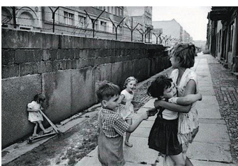
Cartier-Bresson, Mur de Berlin, 1962

Henri Cartier-Bresson (1908-2004) fue quizás el mayor de sus referentes, en gran medida por su forma de entender la práctica fotográfica y que plasmó en su libro El momento decisivo . En él Cartier-Bresson defendía la teoría de que el fotógrafo debía estar preparado para apretar el disparador justo en el momento