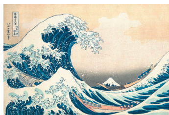
La gran ola, 1830

Muchas obras de la serie que representa al monte Fuji lo son, aunque esta es, sin duda, la más reproducida, probablemente por su composición novedosa y original en la que, tras una gigantesca ola en primer plano, el monte aparece asomando al fondo del paisaje. En realidad, la estampa muestra una vista del Fuji desde el mar en la región de Kanagawa, a unos 100 kilómetros de la montaña más famosa de Japón, donde se considera sagrada. Hokusai fue haciendo bocetos de ella durante los 350 km que recorrió desde su casa para ir a visitar a un aprendiz suyo que vivía en otra región. Durante el trayecto fue haciendo bocetos desde los lugares en los que se iba alojando y a partir de ellos creó luego las planchas para hacer las xilografías de su serie más conocida.