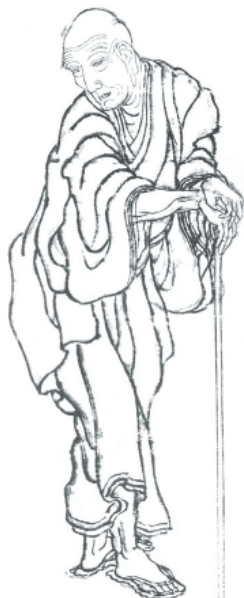
Autoretrato de Hokusai, 1939

Hokusai (1760-1849) es uno de los artistas japoneses más reconocidos de todos los tiempos. Fue un grabador y pintor que llevó a cabo una obra enormemente prolífica y variada entre finales del siglo XVIII y mediados del XIX, y que ha pasado a la historia del arte universal por haber creado una de sus imágenes más icónicas: La ola de Kanagawa (también conocida como La gran ola ). Esta obra forma parte de una serie llamada Treinta y seis vistas del monte Fuji , perteneciente al género del ukiyo-e.