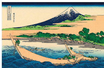
Orilla de la bahía Tago

En realidad, aunque gozaban de gran popularidad entre los japoneses (al ser grabados en madera, se podían reproducir muchas copias y por lo tanto eran económicamente accesibles para una gran parte de la población), estas estampas no tenían un valor artístico reconocido como tal. Su consideración como obras de arte la adquirieron cuando fueron conocidas en Occidente y resultaron muy apreciadas entre la población y también por reconocidos artistas europeos, como Monet o Van Gogh. Éstos, admirados por sus trazos y su colorido, por su particular estilo y originales composiciones, las utilizaron como fuente de inspiración para sus obras.