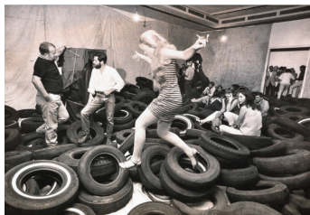
Yard (1961), de Alla Kaprow

Esta forma de hacer arte se generalizó a partir de la década de los 60 del siglo XX, junto a otras que también surgieron entonces, como el happening o la performance . Sin embargo, uno de sus primeros antecedentes los encontramos a finales de la década anterior, los años 50, en los conocidos como environments del artista norteamericano Allan Kaprow . Sobre el primero que hizo el propio artista declaró: