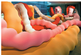
Obra de Eva Fábregas

preparada con 39 cubiertos destinados otras tantas mujeres consideradas personajes trascendentales en los campos de la historia, la ciencia y la cultura. Cada uno de los lados del triángulo (utilizado de manera simbólica para representar el concepto de igualdad) agrupa a mujeres de un determinado periodo histórico