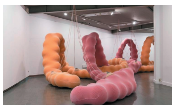
Gut Feeling (2019), de Eva Fábregas

No. También realiza ilustraciones y esculturas con la misma estética de sus instalaciones: formas orgánicas y “ blandas ” en combinación con una gama de colores pastel muy concretos, como el violeta, el rosa, el azul y el amarillo.